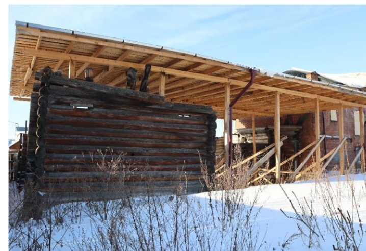
«Амбар», XIX в., входящий в состав «Усадьбы мещан Лапшиных», XIX в.