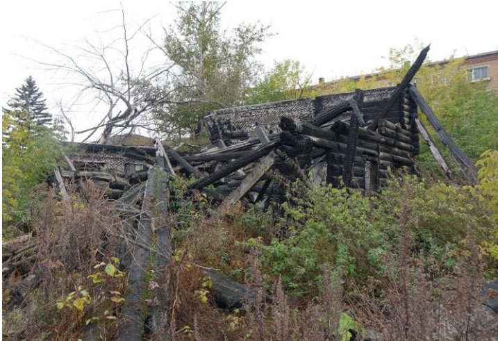
«Флигель», 1890–е гг., входящий в состав объекта «Городская усадьба (дерево)», 1890–е г.