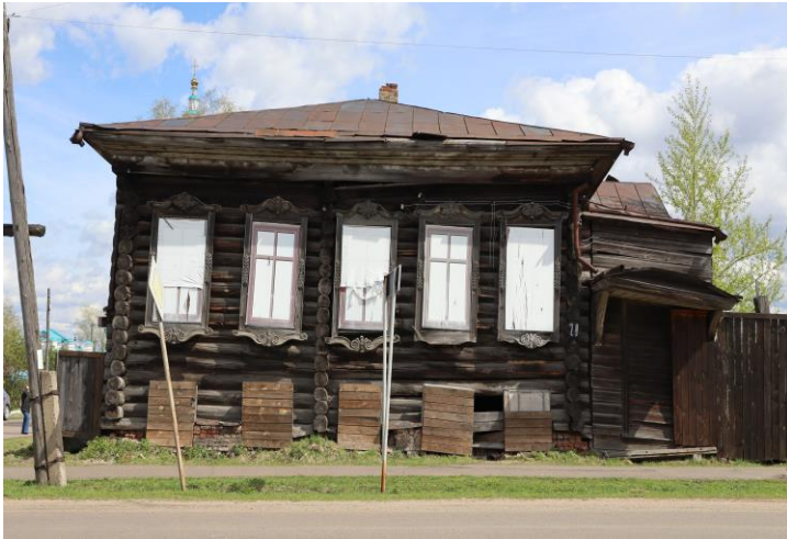
«Дом жилой», кон. XIX в.