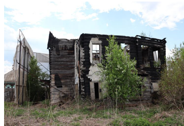
«Дом Щукина», XIX в.