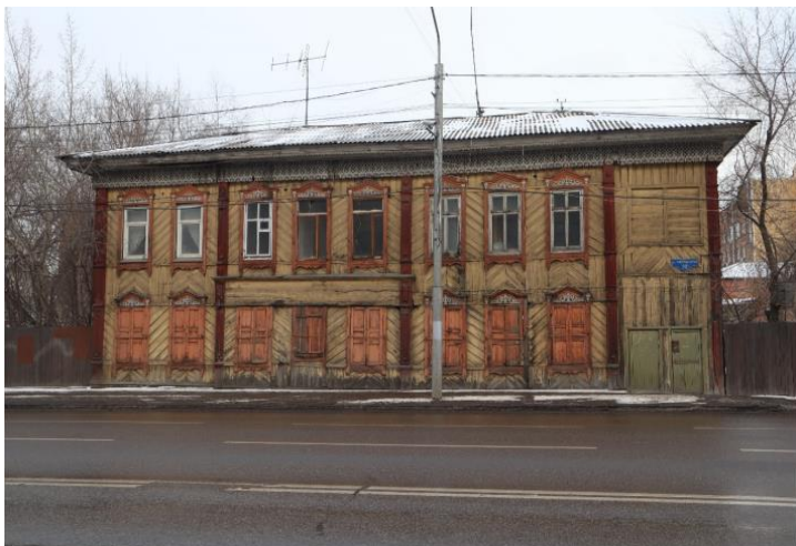
«Дом мещанки Д.Ш.Глянцшпигель», начало XX в.