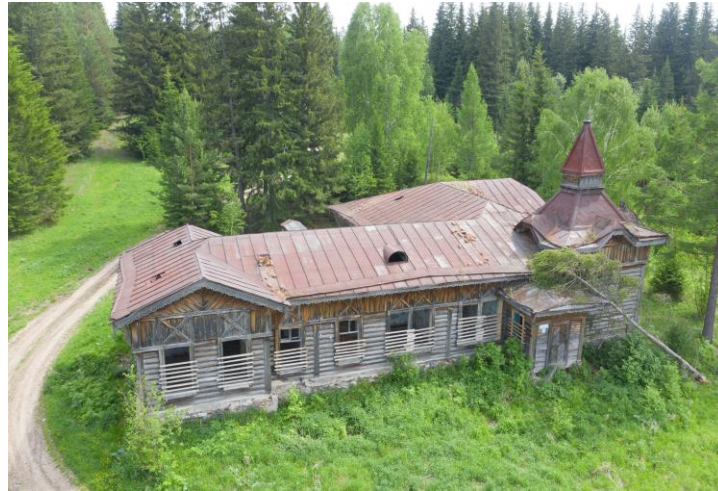
«Здание земской больницы», 1900 г.