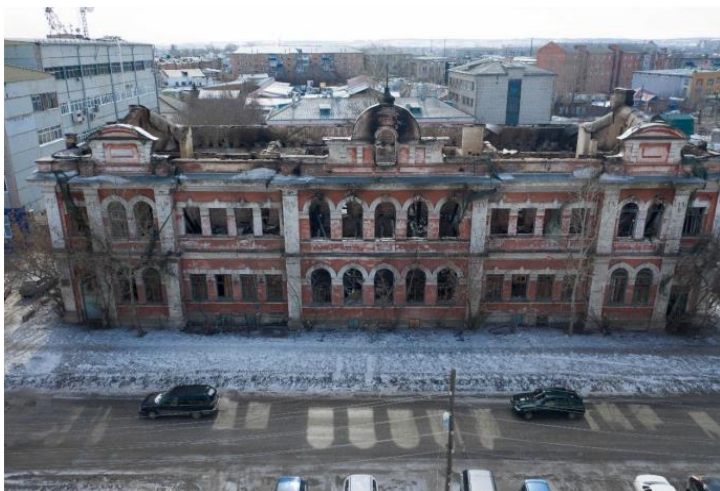
«Общественное здание», нач. XX в.