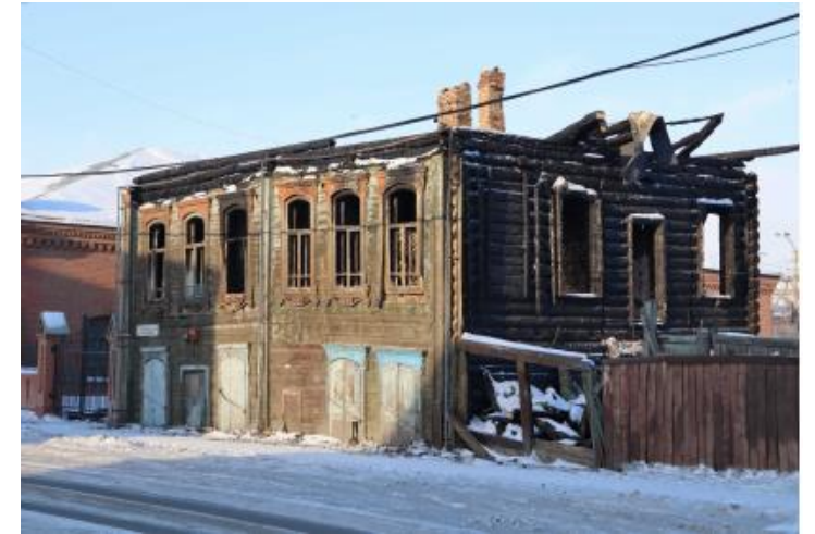
«Жилой дом», входящий в состав объекта «Усадьбы (дерево)», кон. XIX в.