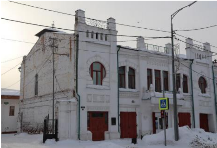
«Дом Бородкина», 1909 г.