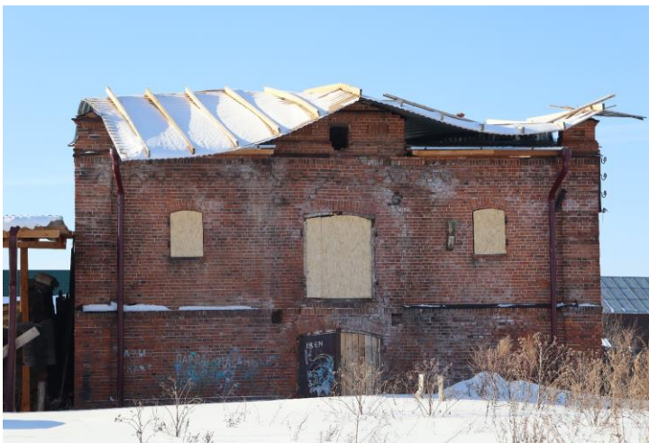
«Пакгауз», XIX в., входящий в состав «Усадьбы мещан Лапшиных», XIX в.