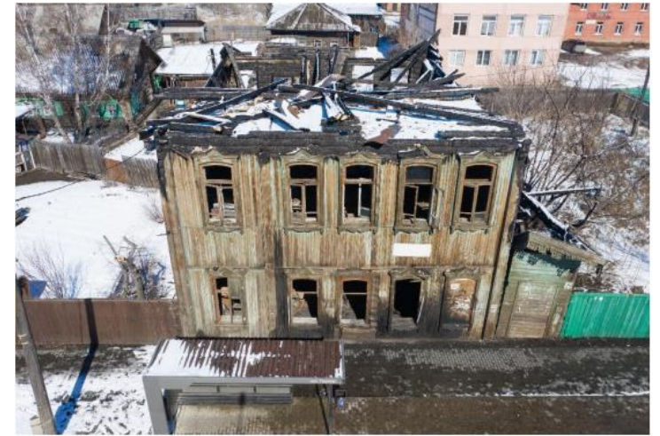
«Дом жилой (дерево)», 1905 г.