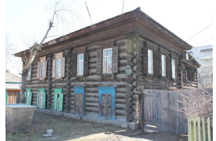
«Здание, где находилась подпольная явка минусинских большевиков», 1918 – 1919 гг.