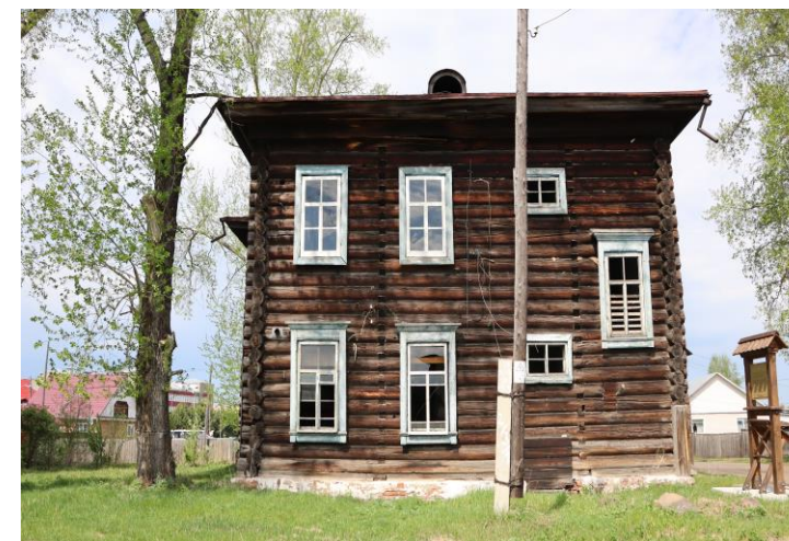
Здание, где в городской больнице в 1828–1830 гг. лечились декабристы