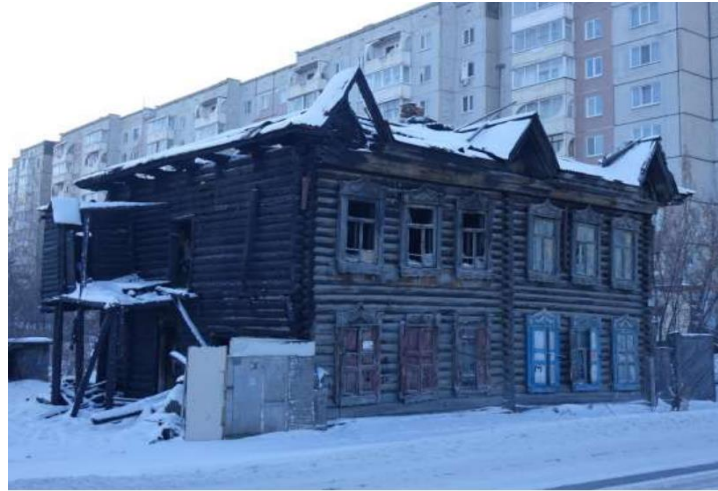
«Дом жилой», кон. XIX в.