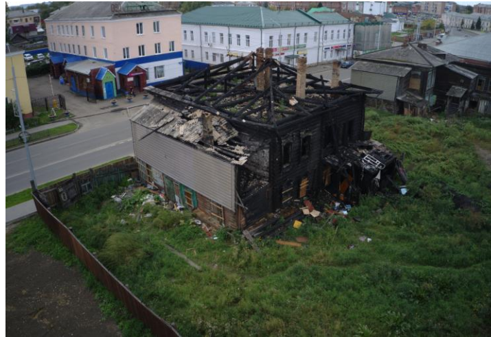
«Дом жилой (дерево)», конец XIX в.