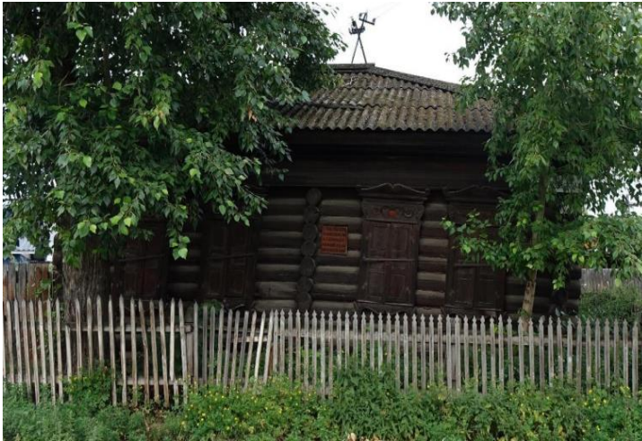
«Дом, в котором в сентябре 1909 года в течение 7 дней жил Ф.Э.Дзержинский», 1909 г.