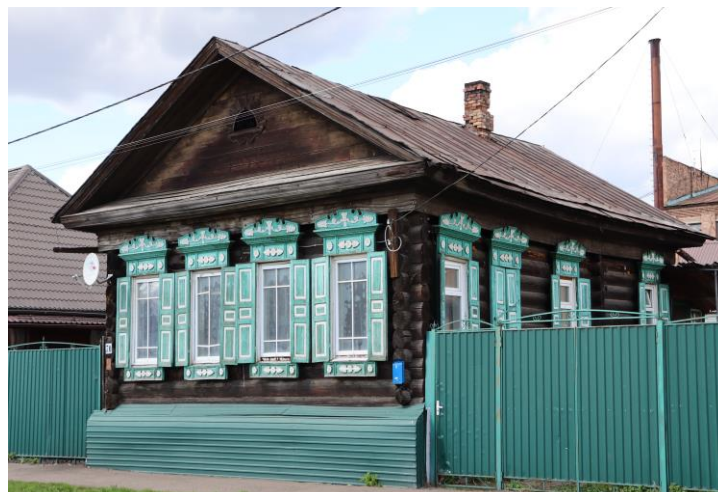
«Дом жилой», кон. XIX в., входящий в состав «Усадьбы Бычкова», конец XIX в.