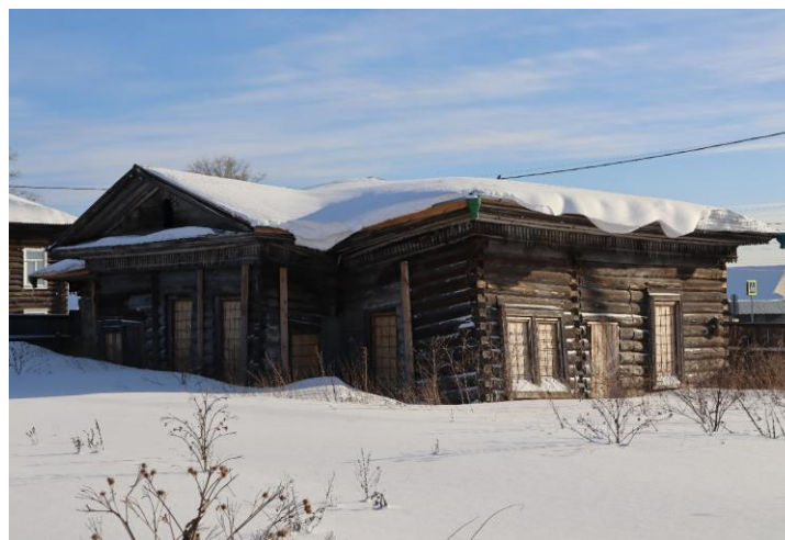
«Дом жилой», XIX в., входящий в состав «Усадьбы мещан Лапшиных», XIX в.