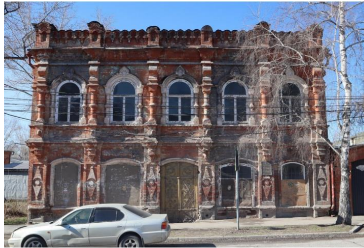
«Дом жилой с магазином», кон. XIX в.