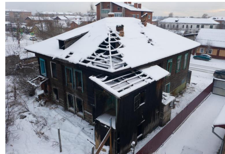
«Дом, в котором в 1897–1903 гг. жил Кон Феликс Яковлевич», 1897–1903 гг.