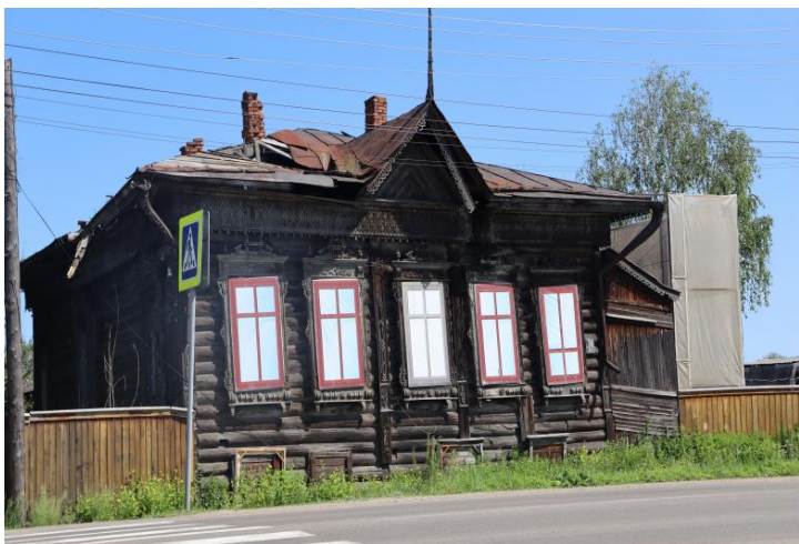
«Жилое здание (дер.)», кон. XIX в., входящий в состав «Комплекса жилых зданий (дер.)», кон. XIX в.