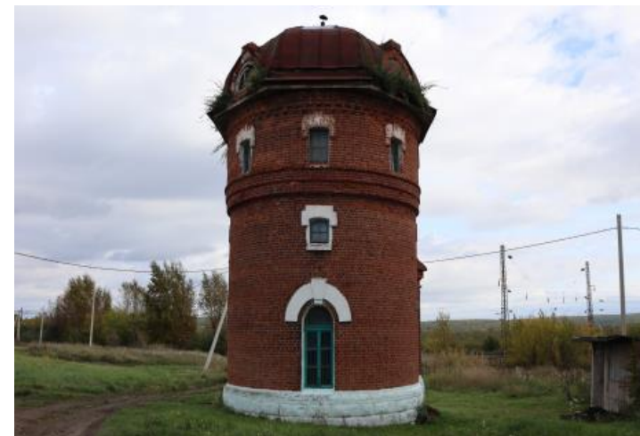
«Водонапорная башня», 1900–е гг., входящий в состав «Комплекса станционных построек», 1900–е гг.