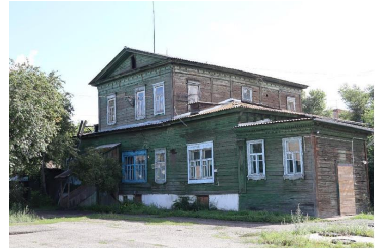
«Дом И.Г.Гусева», 1860–1867 гг.