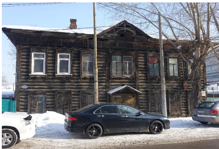
«Дом жилой», начало XX в.